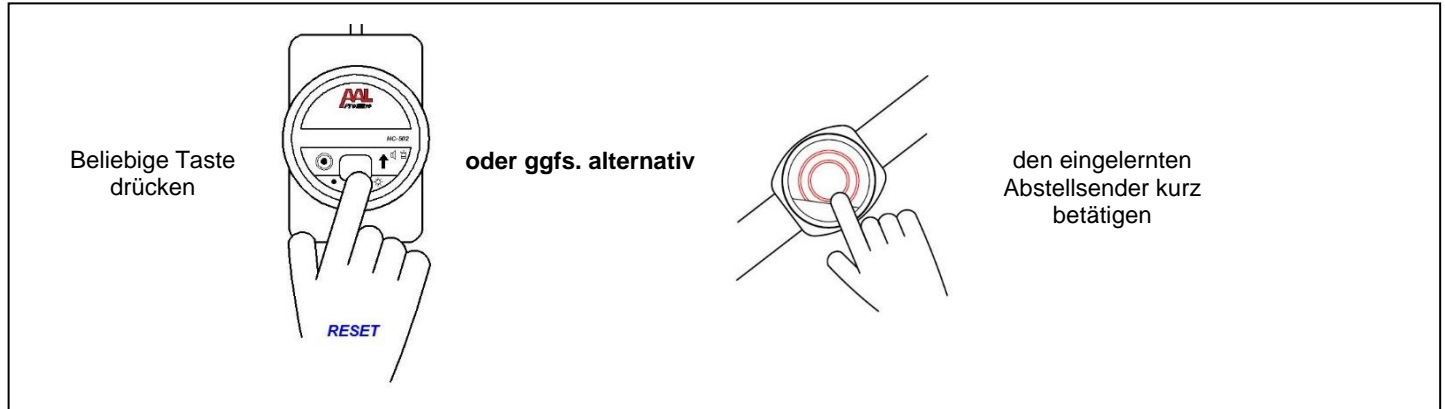
Bild 6: Alle eingelernten Sender löschen und die Einstellungen zurücksetzen auf Werkseinstellung